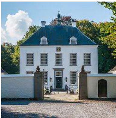
Het Witte Kasteel

De eerste dagexcursie brengt ons naar Midden-Brabant. Daar bezoeken we achtereenvolgens Het Witte Kasteel en de tuin Hof't Einde, beide in Loon op Zand en als derde tuin De Beukenhof in Sleeuwijk. Het traditionele kwekerijbezoek leggen we af bij Kwekerij Bijenkans in Groenekan.